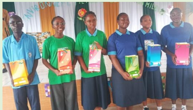
Sacs cadeaux faits à partir d'un matériel de récupération : les couvertures de cahier