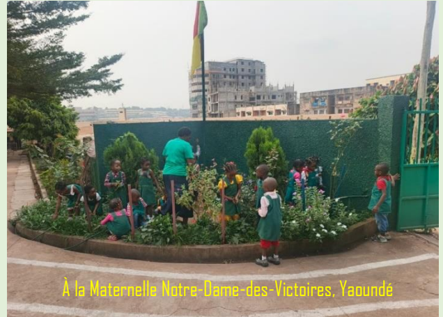
À la Maternelle Notre-Dame-des-Victoires, Yaoundé